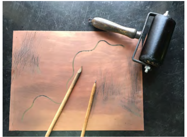
Bearbeitete Kupferplatte und verschiedene Werkzeuge.