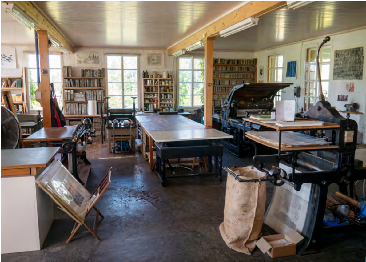
Die Druckwerkstatt in Speicher, seit Generationen in Familienhand.

Urs Graf ist Steindrucker. Seine Werkstatt befindet sich in Speicher, wo er auch Kurse und Führungen anbietet.