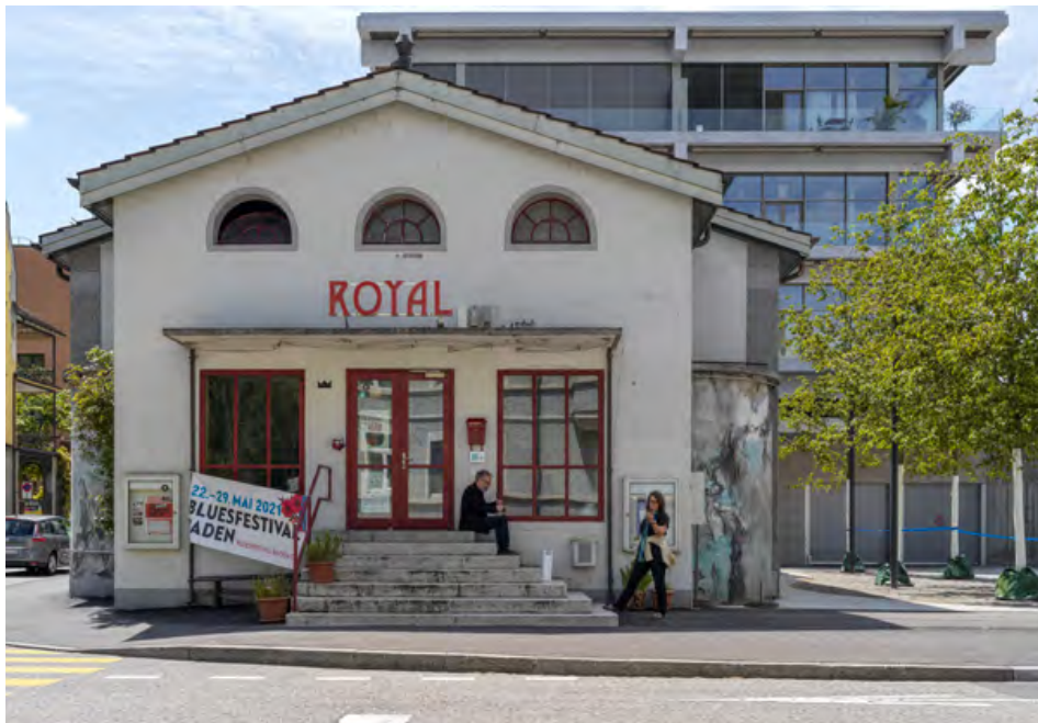
Das 1913 eröffnete älteste freistehende Kino der Schweiz konnte 2011 vor dem Abbruch bewahrt werden. Heute dient es als multimediales Kulturhaus.

«Eine fast schon poetische Anleitung zur Begehung des ganz in der Nähe des Kinos gelegenen Kurparks gab es mit auf den Weg.»