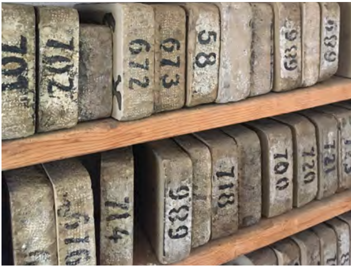
Aus Kalk und möglichst feinkörnig müssen die Steine für die Lithografien sein.