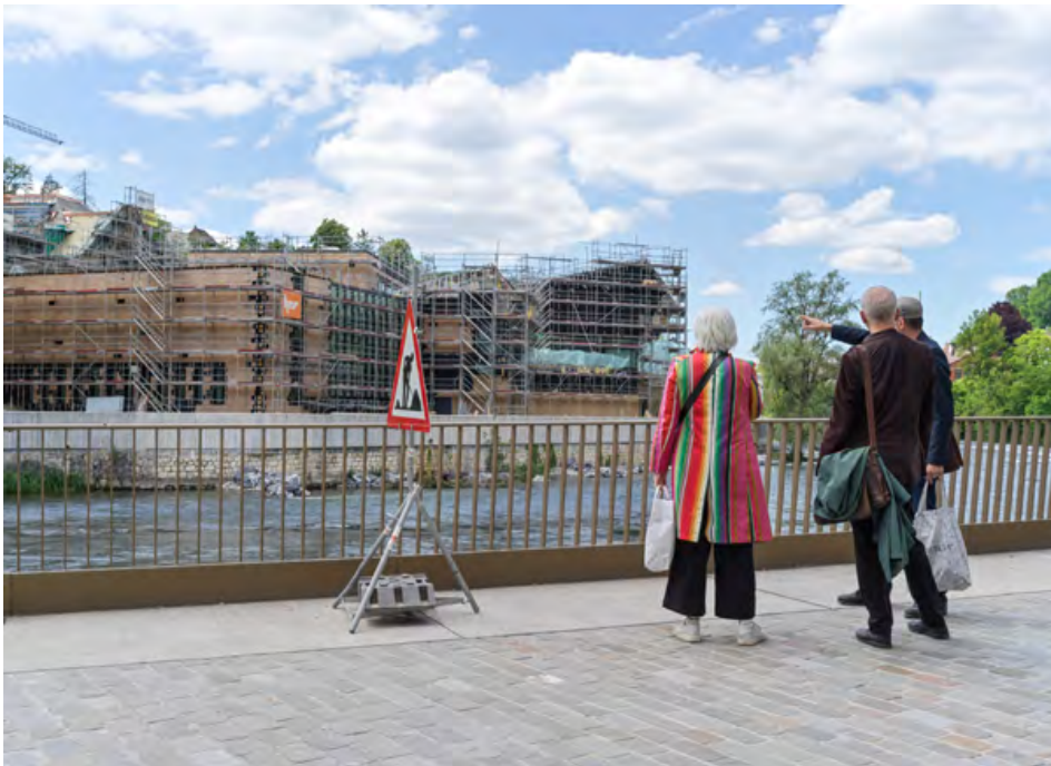
Die Neubauten im Bäderquartier regen zu Diskussionen an.