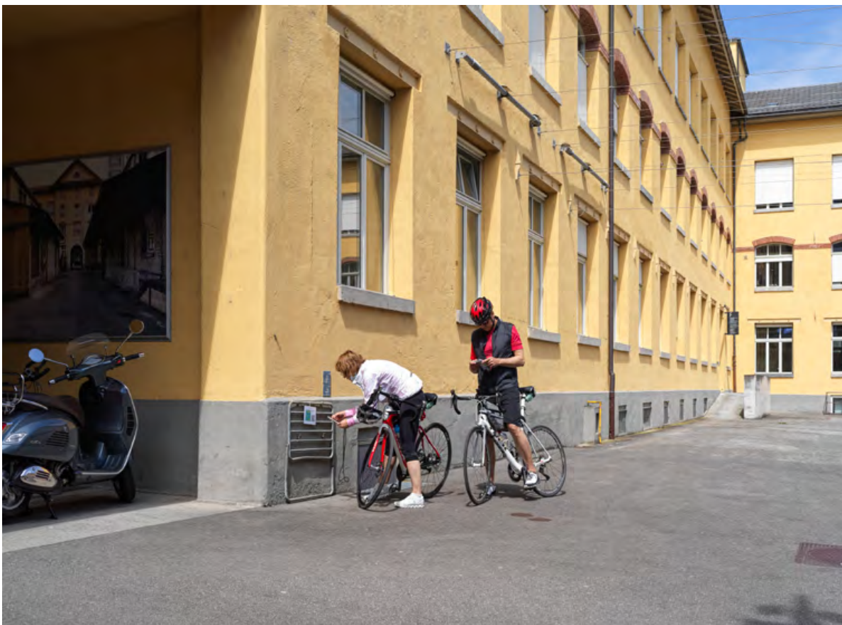
Mit dem Velo ging es etwas schneller. Station Nr. 2 im Merker-Areal.

Wir hatten das grosse Glück, für den Stadtpaziergang auf die Mithilfe unserer Mitglieder und