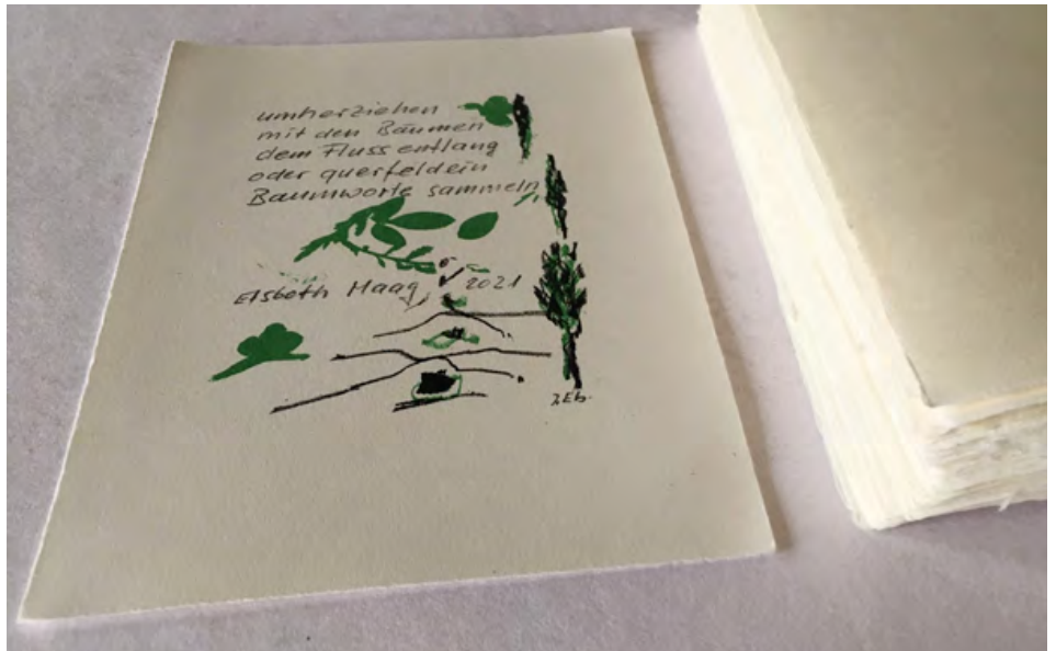
Büttenpapier: ein ideales Material für Originalgrafiken. Foto: Urs Graf.

Ich drucke fast ausschliesslich auf Büttenpapier. Ein solches Papier besteht zu hundert Prozent aus Pflanzenfasern, vor allem Baumwolle oder Leinen. Es ist weich, vergilbt nicht und ist auch haptisch enorm angenehm. Je nach Drucktechnik wird das Papier vor dem Druck leicht befeuchtet, damit es die Farbe beim Druck besser aufnehmen kann. Die Wahl des richtigen Papiers macht erstaunlich viel aus. Man sieht und spürt dies sofort, wenn man bei der heutigen Flut an Drucksachen etwas darauf achtet.