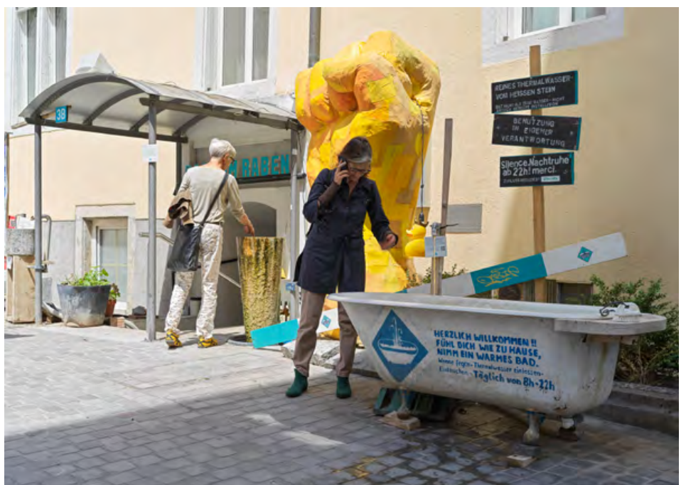
Frei nutzbares Quellwasser im Bäderquartier.